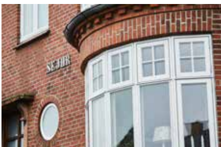
➤ Design vinduerne så de passer til husets stil

Det betyder, at du kan bibeholde bygningens klassiske udtryk, selv om vinduerne er helt nye og lever op til moderne energimærkning.