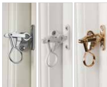
➤ Bredt udvalg af gennemtænkt tilbehør