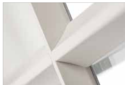
➤ Smukke sprosser fuldender udtrykket