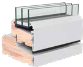
➤ VELFAC Classic karmudsnit

Serien består af vinduer og døre i en alu/træ konstruktion, der kræver minimalt vedligehold, eller i en smuk, ren trækonstruktion. 3-lags ruden med energimærke A hjælper godt til at holde på varmen. Du kan dog få en 2-lags konstruktion med energimærke B, som er godkendt til fx udhus eller sommerhus.